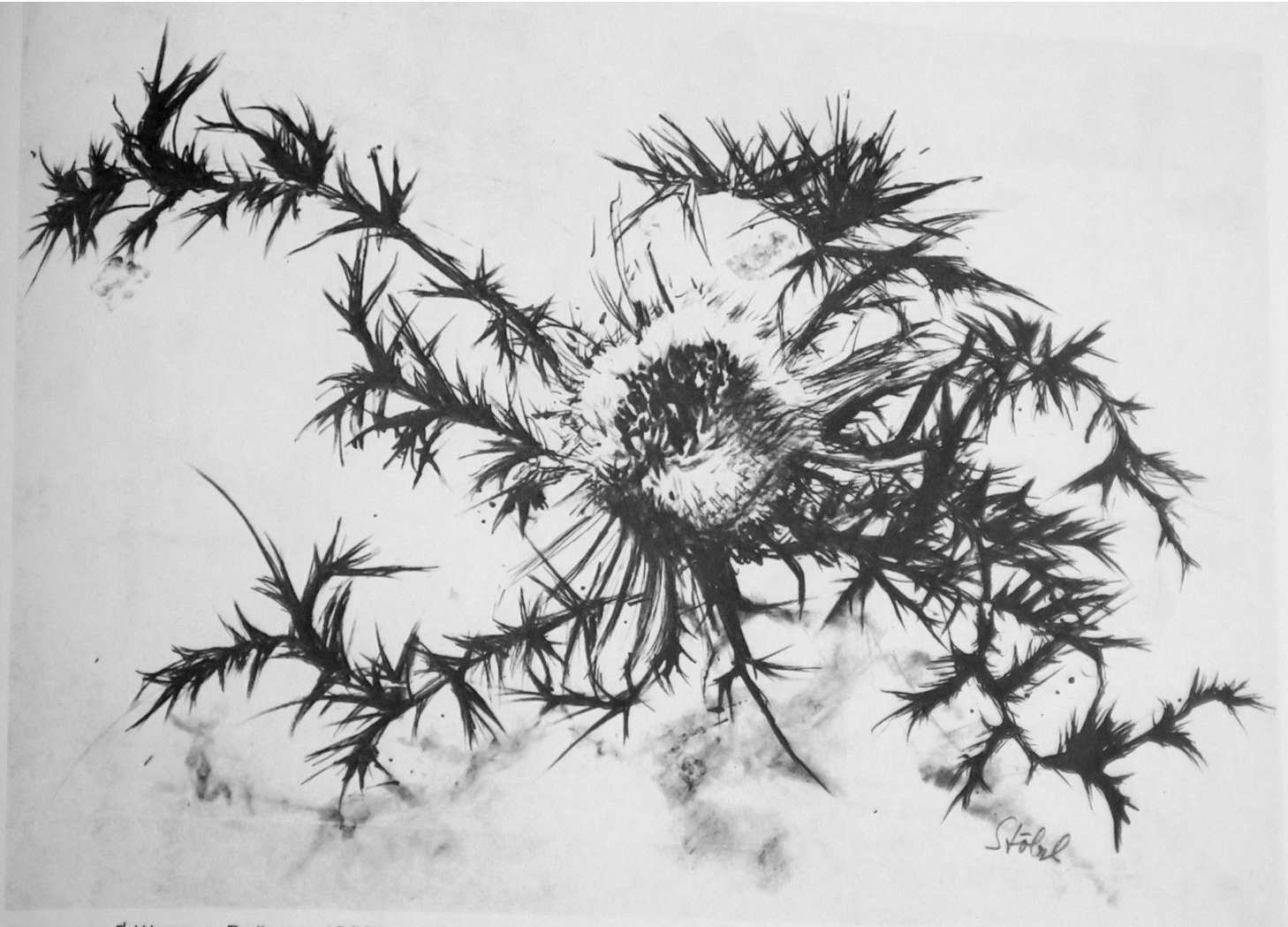
Чортополох. Г. Штольц. Веймар, 1920 р.

Той, хто хоче намалювати чортополох, спершу має побачити гострі кінчики цієї рослини, спрямовані в різні боки. Під час малювання треба пам'ятати про агресивний