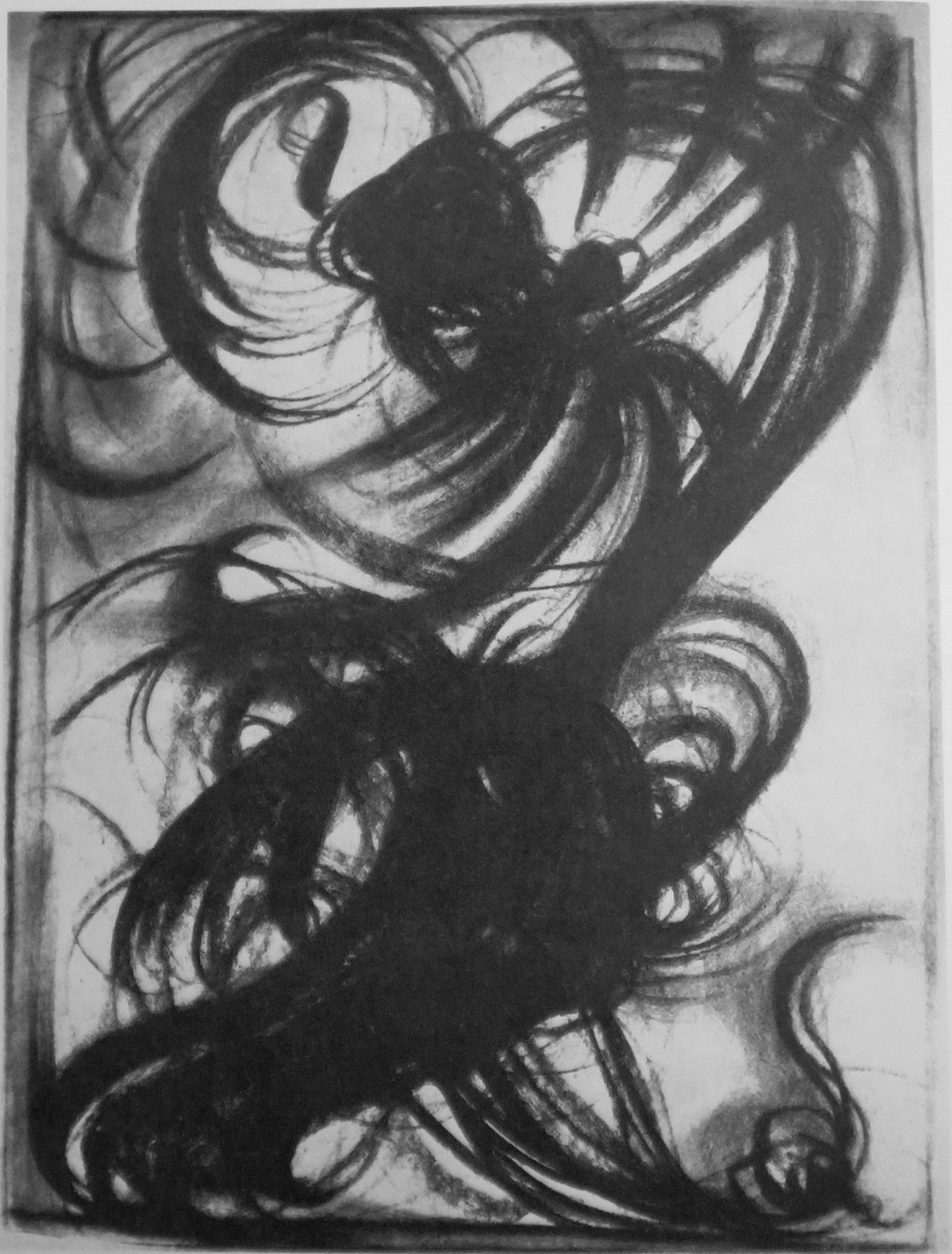
Ритмічна форма, що постала з потужного імпульсу. М. Тері-Адлер. Відень, 1918 р.