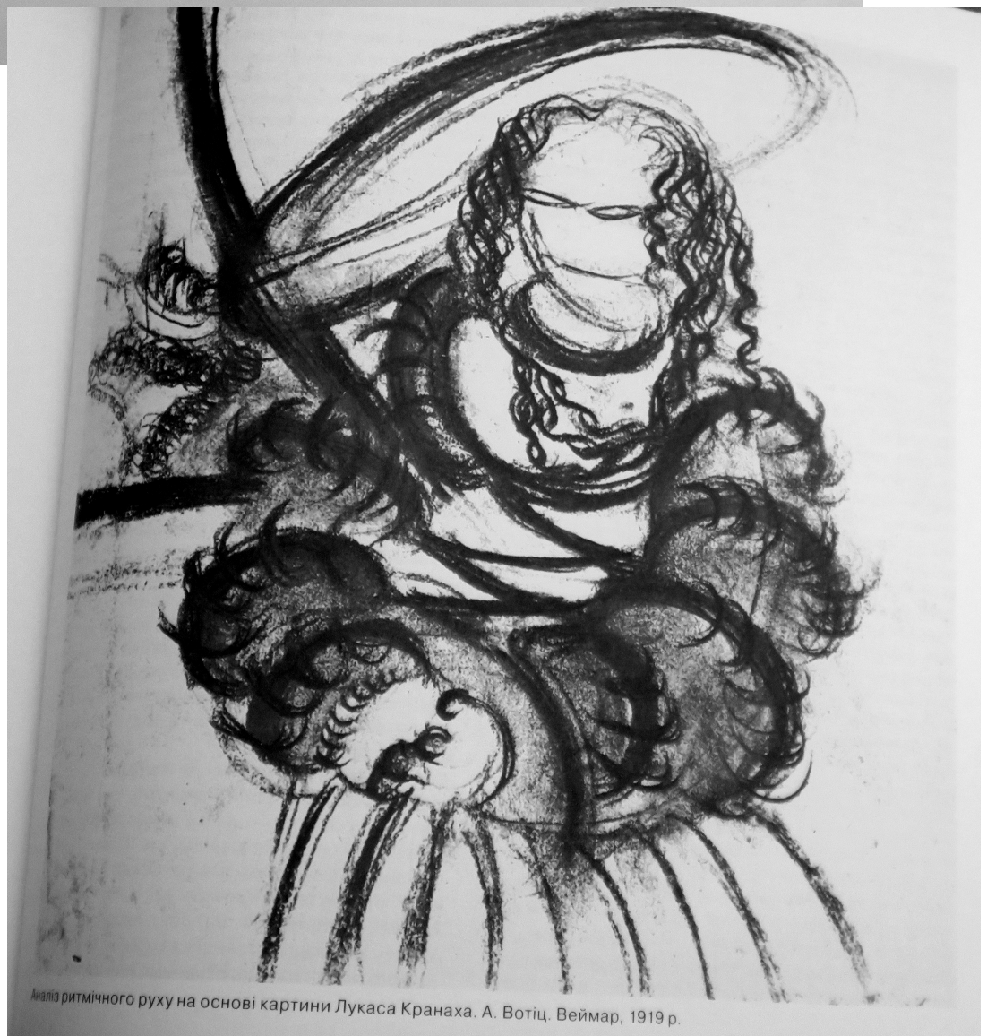
Аналіз ритмічного руху на основі картини Лукаса Кранаха. А. Вотіц. Веймар, 1919 р.